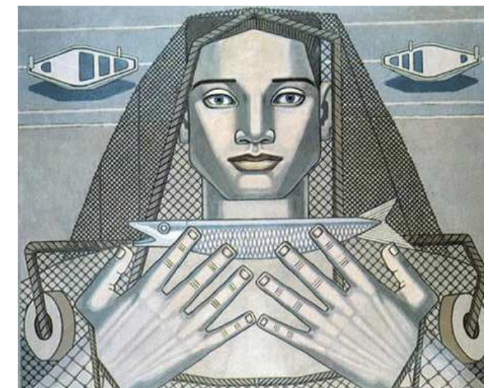
Arquitectura humana (1937)

No verán de 1936 está en Galiza a traballar no “Caderno de Galicia” onde debuxa todo tipo de aparellos de pesca, redes, nasas, os rostros da xente do mar mais tamén campesiñ@s. O golpe militar fascista sorpréndea aquí, en Galiza, e permanece agochada até que logra fuxir a Portugal e alí con axuda de Gabriela Mistral, embaixadora de Chile en Lisboa, consegue viaxar ata a Arxentina en febreiro 1937, onde se instala. Comezará aquí unha nova serie A Relixión do traballo dentro da estética do seu cadro A sorpresa do trigo (1936) obra de grande rigor compositivo. Esta nova serie está integrada por sete óleos que representan mariñeir@s e campesiñ@s.