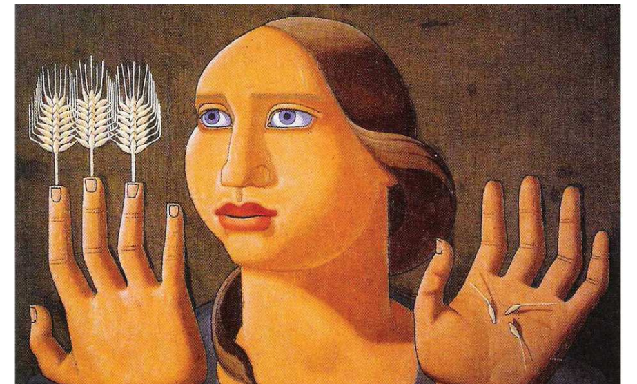
A sorpresa do trigo (1936)

Na manifestación do 1º de maio de 1936 está Maruxa Mallo en Madrid e vai chegando moita xente que vén de lonxe camiñando e repentinamente aparece entre a multitude un brazo que alza un enorme pan. Maruxa preguntalles: