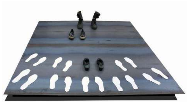
Peza escultórica de Pepe Galán

As Mulleres Muro é a historia das mulleres que no verán de 1936 fan do seu corpo un valo, un parapeto, poñéndose diante do cárcere da Coruña cada día e cada noite para impedir que saian presos da cadea para ser “paseados”. Despois do golpe de Estado de 1936, comezan os viles asasinatos de mulleres e homes, sen xuízo, moitos son encarcerados. Cóntase que ducias de mulleres da cidade, vendo o que está a pasar coas persoas presas e como todos os días aparecen cadáveres no Campo da Rata ou nas estradas da contorna, colócanse diante do cárcere, día e noite, para impedir sacar os presos; e que cando algunha delas era arrastrada ou golpeada e xa non podía seguir alí, unha ducia viña ocupar o seu lugar.